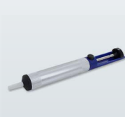
ENTLÖTPUMPE DE-SOLDERING PUMP