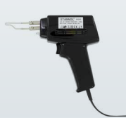
LÖTPISTOLE SOLDERING GUN