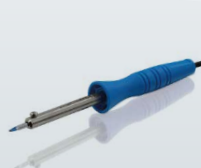
LÖTKOLBEN SOLDERING IRON