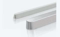
STANGEN & BARREN