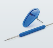
BAUTEILENTFERNER SOLID AID TOOL